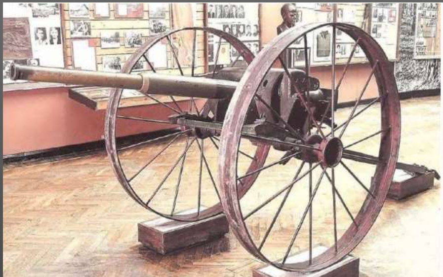
Экспонат музея - пушка, сделанная в отрядной кузнице на основе танкового орудия и колёсах колхозной сеялки.