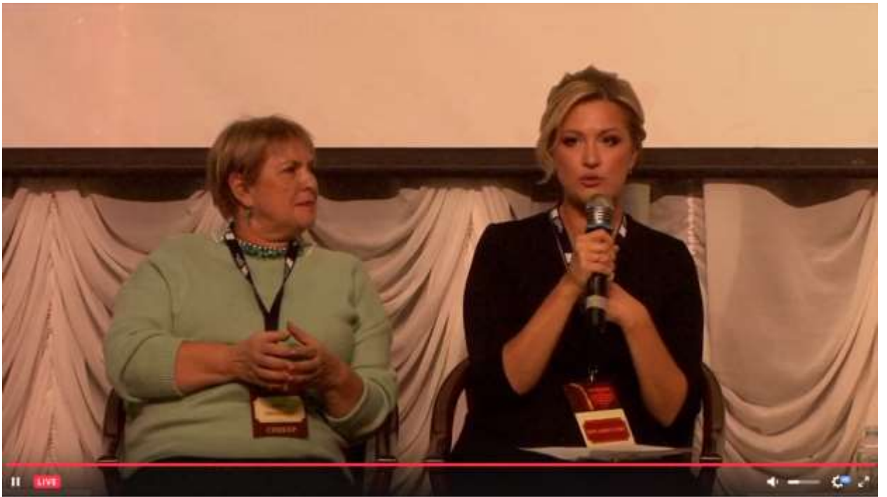
НеКонференция «Театральная педагогика как современный социокультурный феномен»