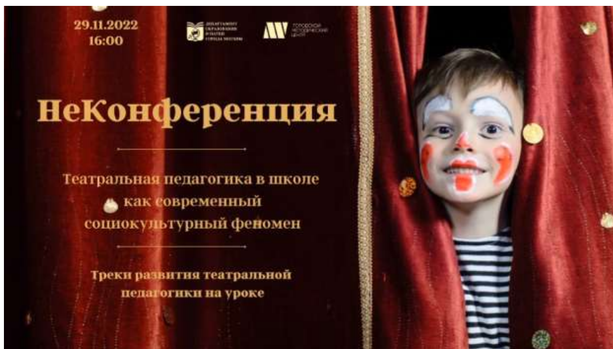
НеКонференция «Театральная педагогика как современный социокультурный феномен»

Организаторы НеКонференции – Департамент образования и науки города Москвы, Городской методический центр.