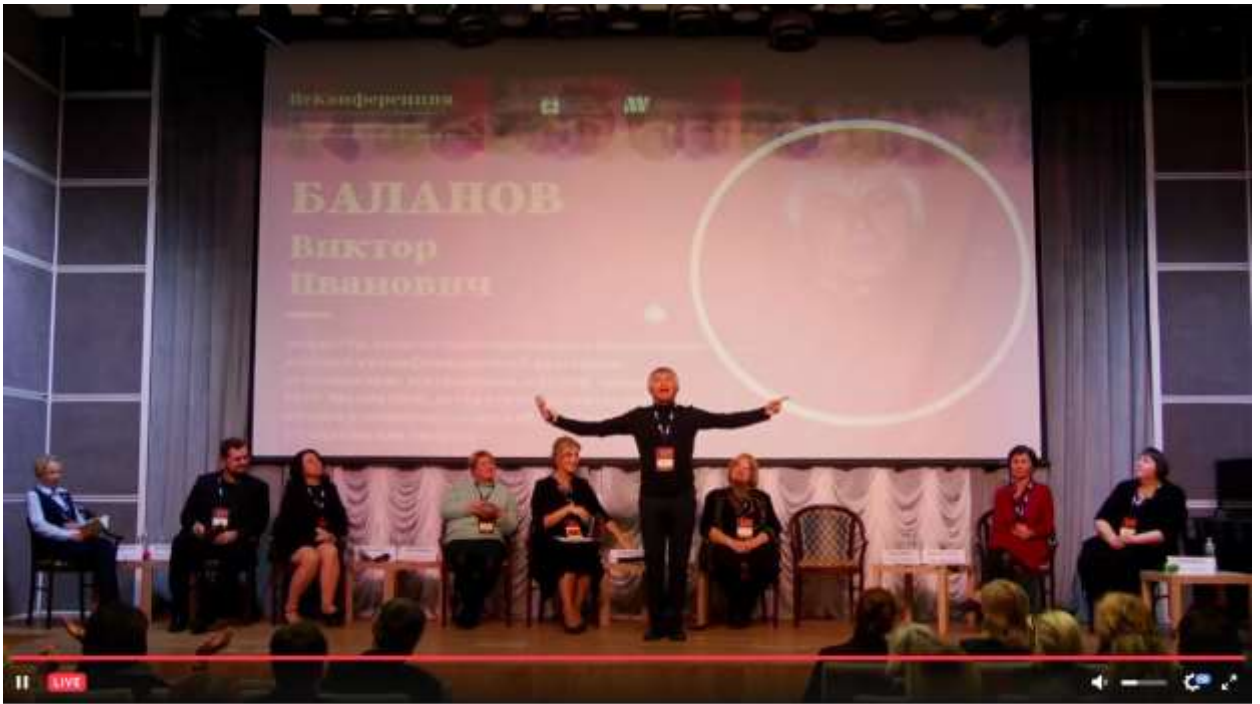
НеКонференция «Театральная педагогика как современный социокультурный феномен»