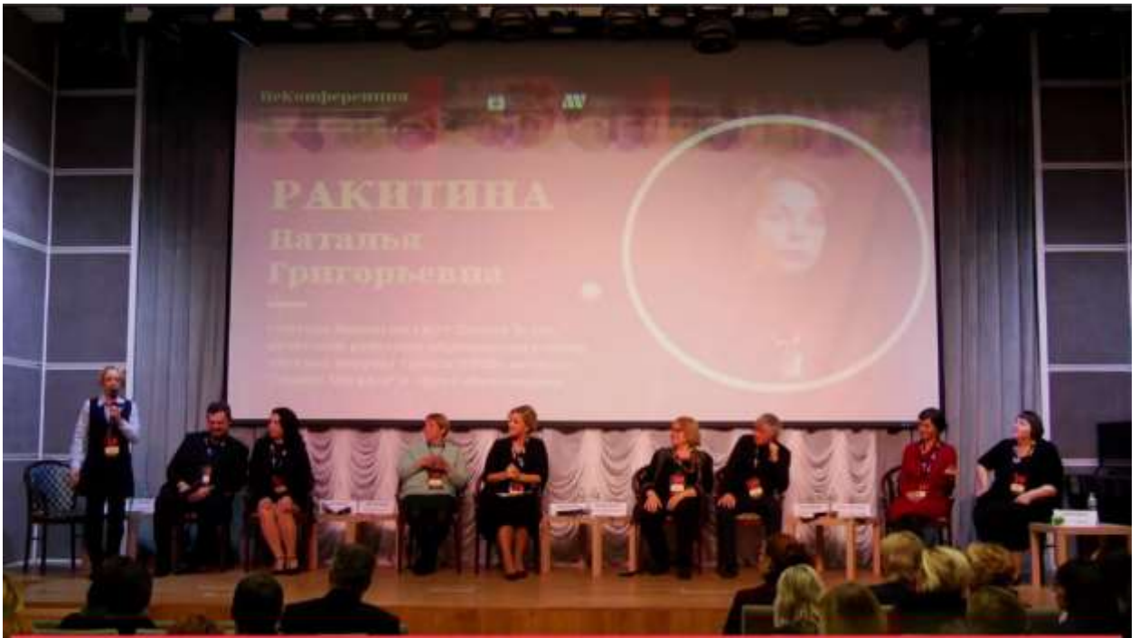
НеКонференция «Театральная педагогика как современный социокультурный феномен»