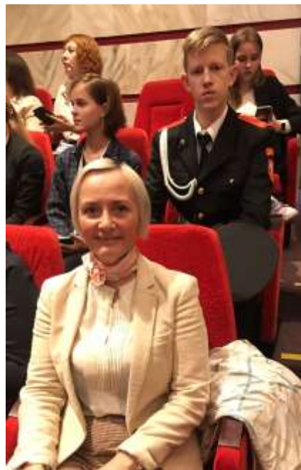
Гос. Музей Победы. На награждении олимпиады «Культурный Маршрут»

Благодарим всех организаторов историко-образовательных мероприятий по местам боевой славы 158 стрелковых дивизий, а также по местам памяти и героических сражений в истории народа в Великой Отечественной войне!