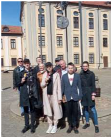
Несвижский замок. г.Несвиж, Беларусь