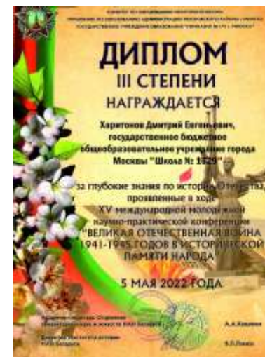
Конференция «ВОВ 1941-1945 годов в исторической памяти народа». 5 мая 2022