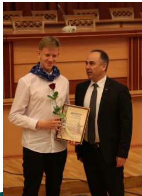
г.Минск. На награждении конференции «ВОВ 1941-1945 годов в исторической памяти народа»

Посещая с ребятами знаковые, памятные места тяжелых боев и гибели героев, невольно становишься, соприкасаясь, участником событий тех военных лет героического прошлого наших предков и беспримерного подвига при защите Отечества.