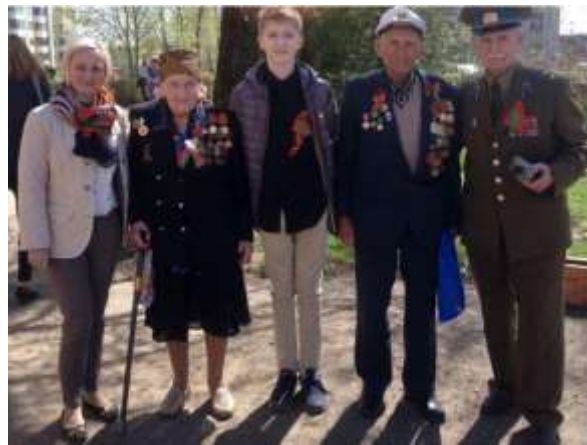
Международный слет школьных Музеев.