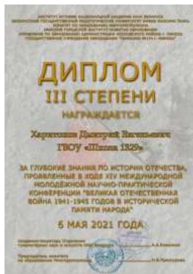
Конференция «ВОВ 1941-1945 годов в исторической памяти народа». 6 мая 2021