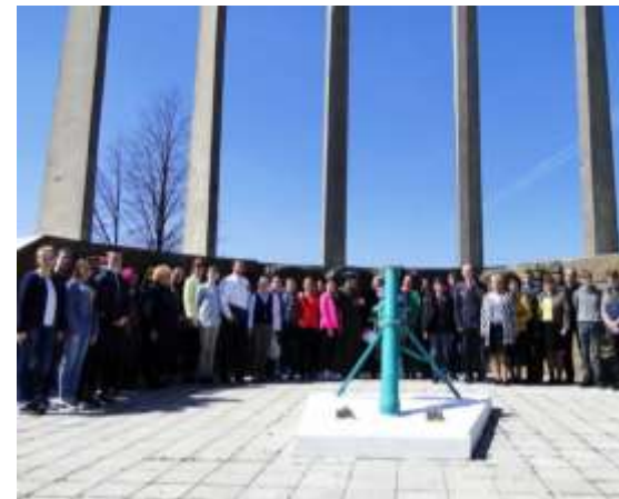
На «Тихмяновской высоте»